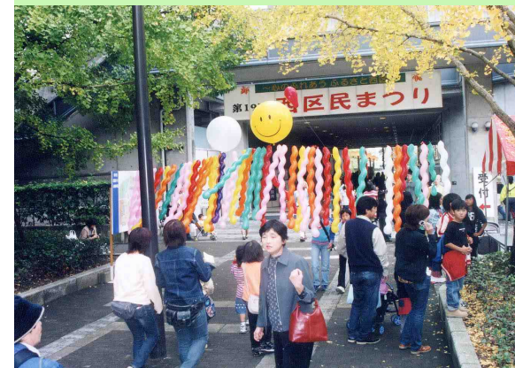
イチョウの黄葉とバルーンが歓迎