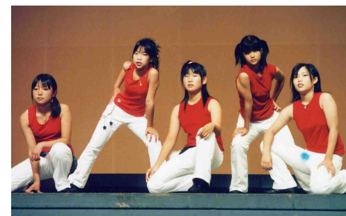
ステージでは華麗な演技を披露

11月2日(日)広島サンプラザ及び近隣公園において、第19回西区民まつりが開催されました。好天にも恵まれ、西区民まつり始めて以来の最高の人出(約10万人)を記録しました。