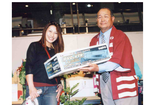
様々な催し物が盛り沢山

また、西区内の児童館による「こどもまつり」も併催されました。会場内では、様々な催し物があり、どこも大変な賑わいでした。最後にお楽しみ抽選会があり、祭りは今年も大盛況のうちに終了しました。前日から準備をしていただいた実行委員会、まつり委員会の皆さん、本当にご苦労様でした。